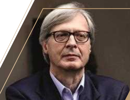
Prof. Vittorio SGARBI LECTIO MAGISTRALIS "Il sorriso nella storia dell' Arte"

Il Prof. Vittorio Sgarbi , noto critico d'arte, ci guiderà attraverso l'analisi di alcuni capolavori della storia in un percorso affascinante in cui il sorriso è capace di acquisire molteplici significati: dalla naturale felicità di un incontro tra due innamorati al ghigno cinico o di dominio di chi gode nel procurare il male altrui, al compiacimento della perfezione, alla spensierata e inconsapevole disinvoltura dell' ubriaco, alla smisurata risata dell' idiota fino all' espressione inquietante della follia umana. Una selezione delle opere più suggestive e un viaggio nei secoli che ci porterà fino ai nostri giorni a capire come il sorriso sia un potente veicolo di comunicazione.